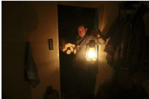
домовладение (квартира) отключено от электроснабжения