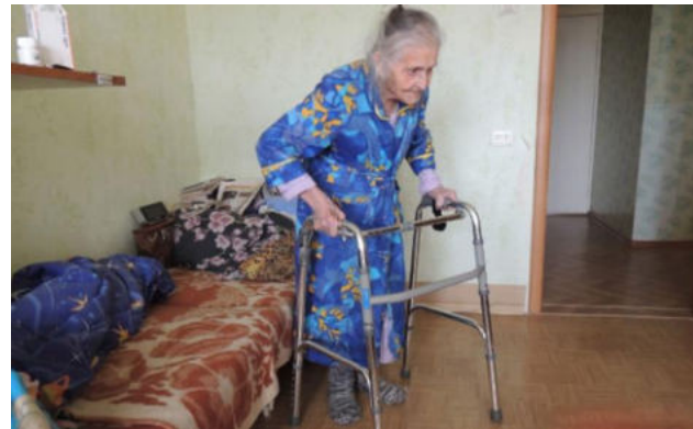
неспособность граждан к самообслуживанию