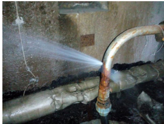
имеется течь из котла