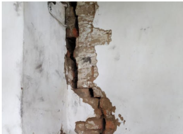
имеется сквозная трещина в печи