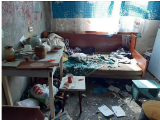
антисанитарное состояние жилья