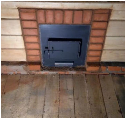
участок пола из горючих материалов (доска, паркет и другое) перед топочным отверстием печи не защищен негорючим материалом (металлический лист, плитка и т.д.)