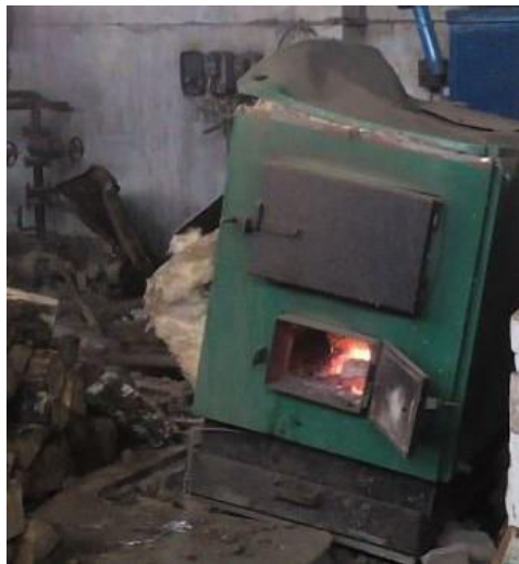
имеется механическое повреждение корпуса котла

Признаки несоответствия установленных теплоустановок требованиям, предъявляемым к их устройству и (или) эксплуатации