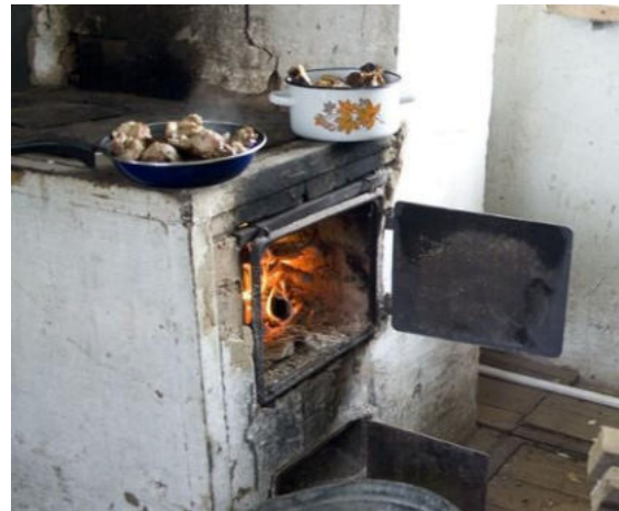
топочная дверца печи неисправна (не закрывается)