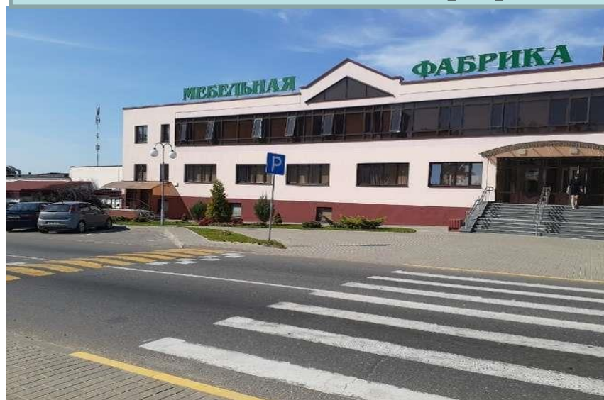
Ф-л «Вилейская мебельная фабрика»