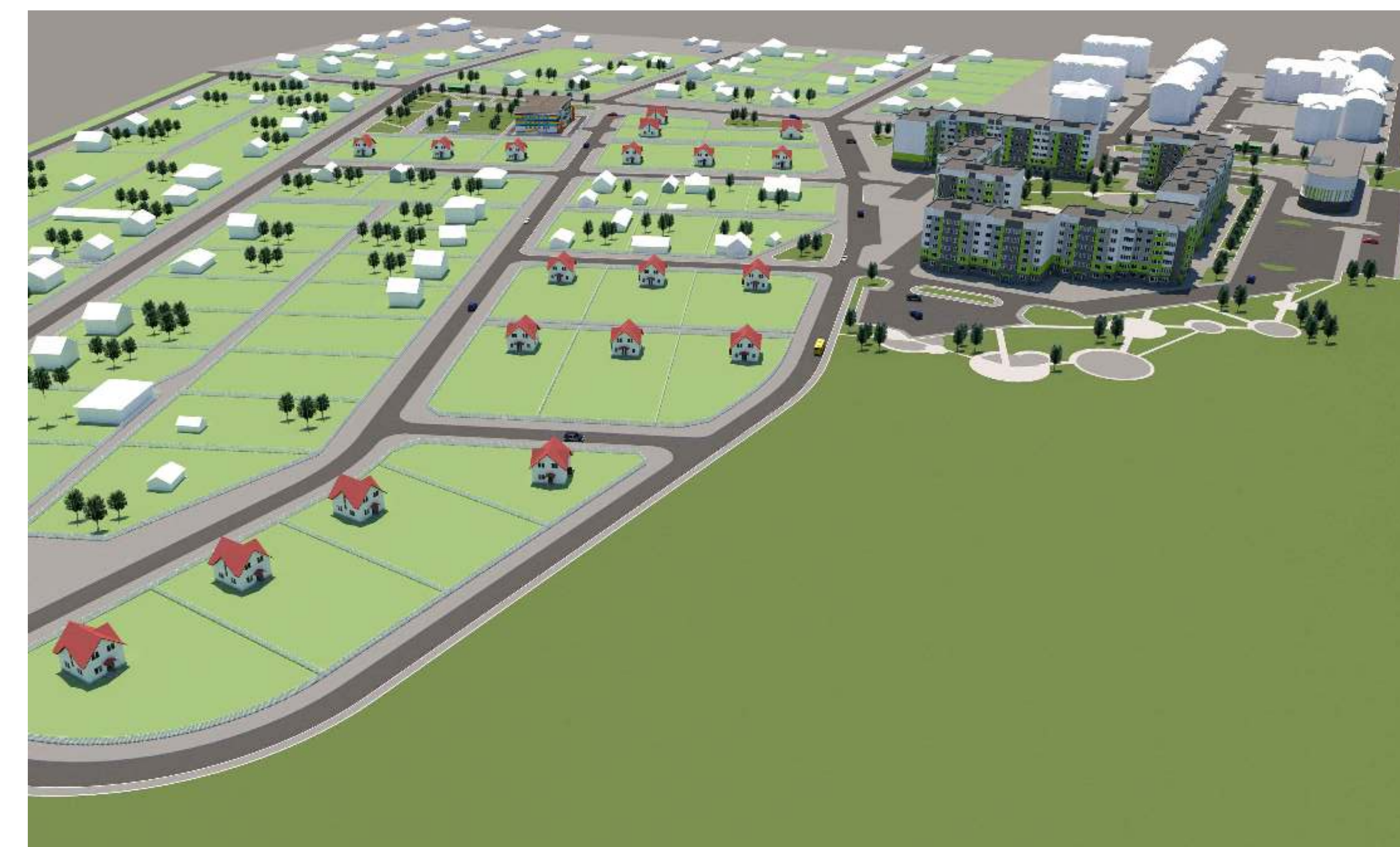
ВИЗУАЛИЗАЦИЯ ГРАДОСТРОИТЕЛЬНОГО ЭСКИЗА ЗАСТРОЙКИ. ВИД СО СТОРОНЫ ЛАНДШАФТНО-РЕКРЕАЦИОННОЙ ЗОНЫ