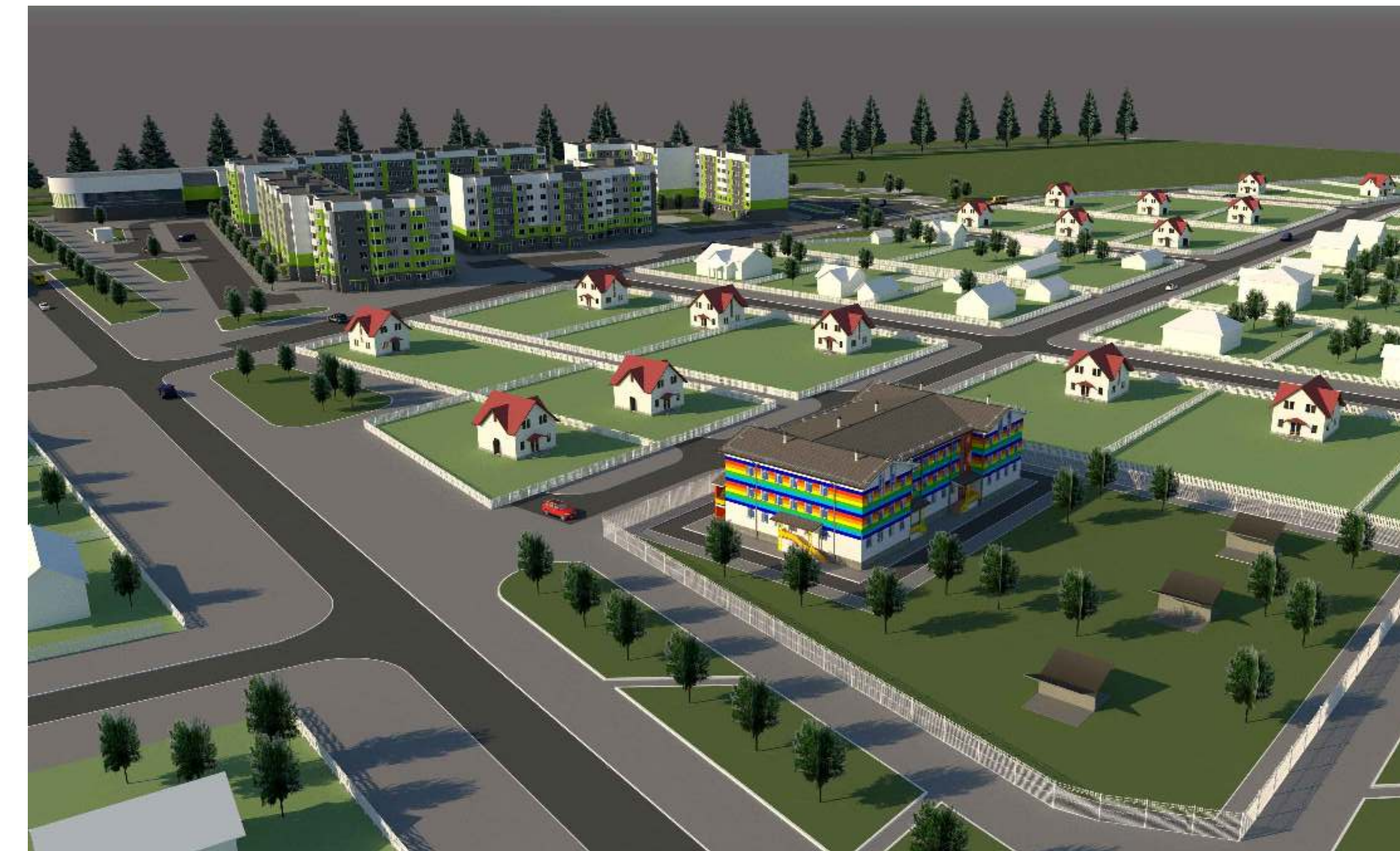
ВИЗУАЛИЗАЦИЯ ГРАДОСТРОИТЕЛЬНОГО ЭСКИЗА ЗАСТРОЙКИ. ВИД СО СТОРОНЫ КВАРТАЛОВ УСАДЕБНОЙ ЗАСТРОЙКИ