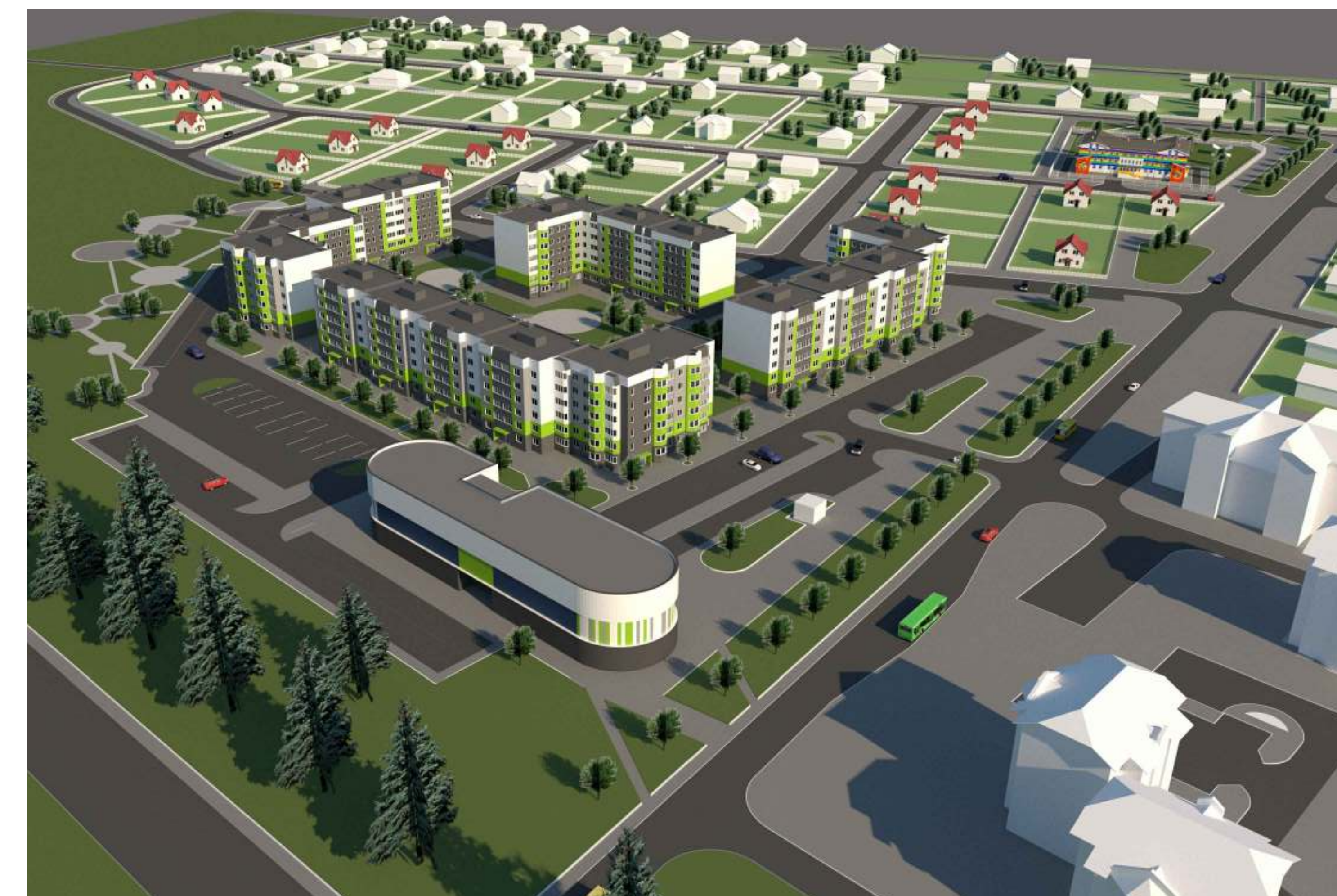
ВИЗУАЛИЗАЦИЯ ГРАДОСТРОИТЕЛЬНОГО ЭСКИЗА ЗАСТРОЙКИ. ВИД СО СТОРОНЫ ПЕРЕСЕЧЕНИЯ УЛИЦЫ ДОБРОЙ ВОЛИ И МАГИСТРАЛИ Р-29