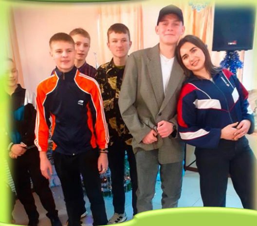
Вечер в стиле ретро